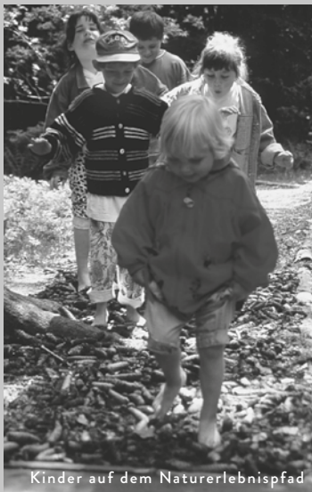
Kinder auf dem Naturerlebnispfad

„Natur begreifen mit allen Sinnen“, dazu lädt der ca. 2 km lange Naturerlebnispfad ein. Auf seinen zehn Stationen wird der Lebensraum Wald auf sehr vielfältige, ungewöhnliche Weise näher gebracht. Man kann den Waldklängen lauschen, mit Naturmaterialien musizieren, Pflanzen ertasten und riechen, Wurzeln in den Himmel wachsen sehen, sich im Baumpavillon ausruhen oder im kühlen Aufichtenwald gelegenen „Märchenkobel“ Geschichten erzählen.