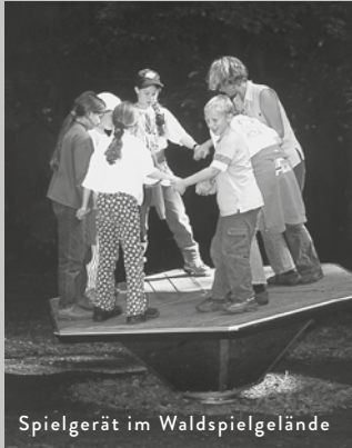
Spielgerät im Waldspielgelände

Frei nach dem Motto „Spielend die Natur begreifen“ bietet das Waldspielgelände Spiel- und Naturerlebnis für die ganze Familie. Besucher des Nationalparks erwartet in diesem 50ha großen parkartig angelegten Waldgebiet ein Naturerlebnispfad, eine Waldwiese und Spielplätze. Zahlreiche Familienveranstaltungen beginnen am Haupteingang beim Parkplatz „Waldspielgelände“, von dem aus das Gelände teilweise auch